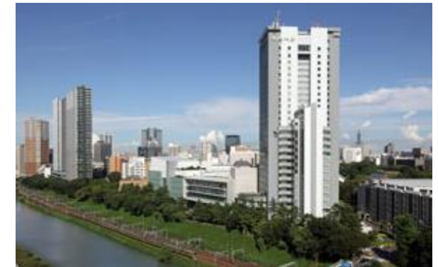
法大市ヶ谷キャンパス